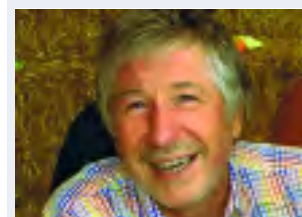
In diesem Sinne ihr

Als WGZ-Vorstandsmitglied nehmen ich und meine Frau sehr oft an WGZ-Veranstaltungen teil. Nebst unseren langjährigen treuen Mitgliedern treffe ich mehr und mehr auch neue Menschen: Neue WGZ-Mitglieder. Gleichzeitig verändern sich die Erwartungen an die WGZ, denn "freie Zeit" will sinnvoll erlebt werden - ja sogar wertschöpfend soll sie sein. Wir vom WGZ-Vorstand haben die Zeichen verstanden. Ab 2013 sind neue Formen von WGZ-Veranstaltungen im Programm. Das persönliche Netzwerk von WGZ-Mitgliedern und neuen WIR-Verrechnern erlebt neue Dimensionen. Profitieren Sie - kommen Sie mit.